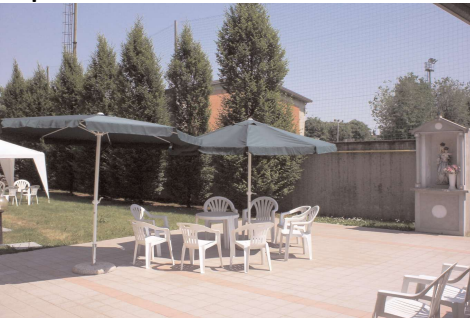
Una parte dello spazio esterno