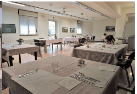
La sala da pranzo