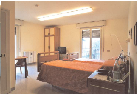
Una camera a due letti