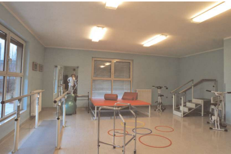
La palestra attrezzata